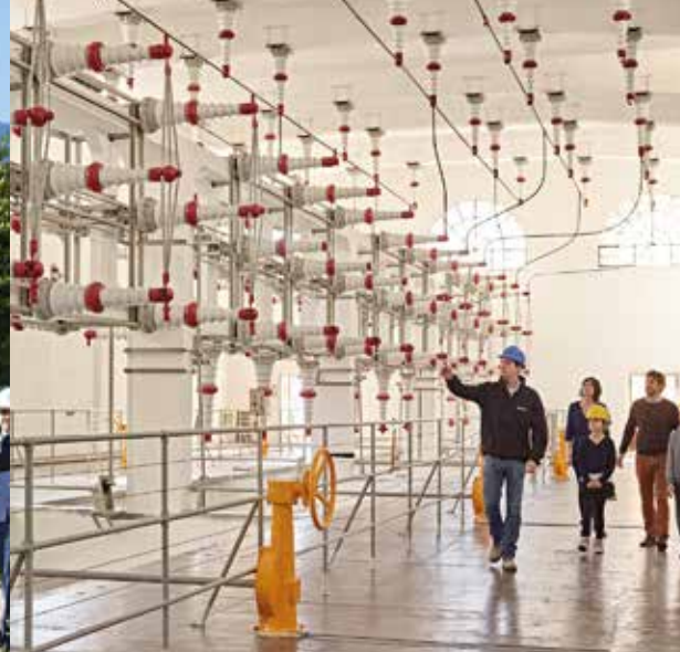
Riva del Garda